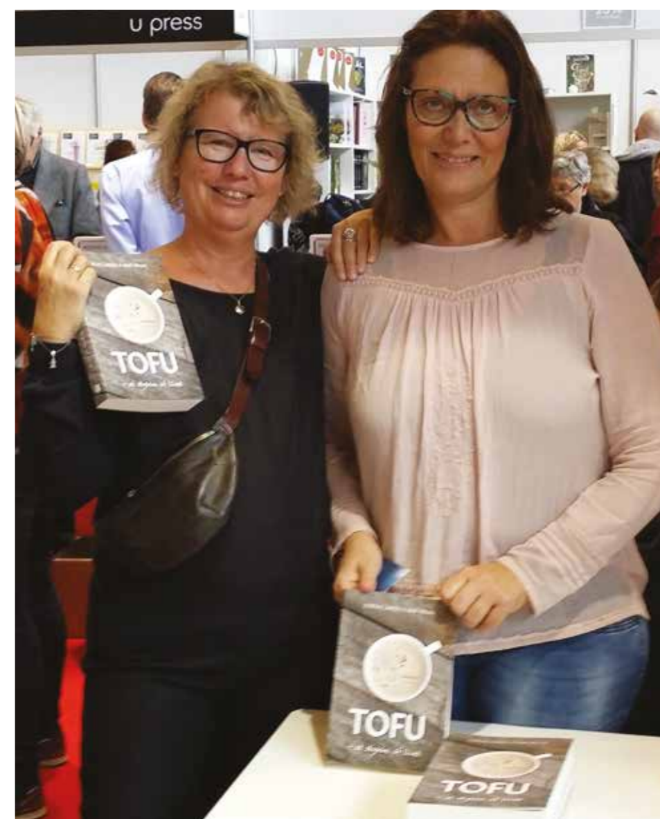
Af Randi Krosgaard

Forlaget Mellemgård, 2015. 404 sider, 269,95 kr.