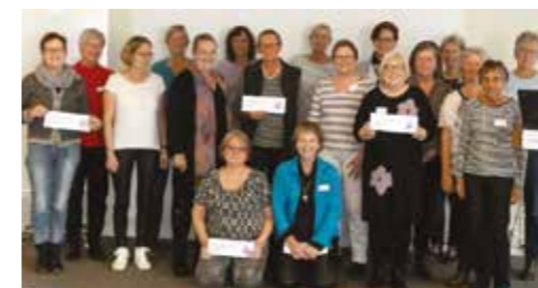
De medvirkende på seminaret.

DBO's niende 'Weekendseminar for kvinder med tilbagefald' blev afholdt d. 6.-8. november 2015, og deltagerne var enige om, at samværet med ligesindede var meget styrkende.